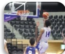
2年連続優勝の バスケットボール少年男子