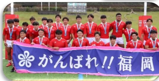
準優勝のラグビー少年男子

滋賀県希望が丘文化公園（野洲市）にて行われたラグビーフットボール競技少年男子。10/3の1回戦で北海道に77-12、10/4の2回戦で宮城県に81-5、10/6の準決勝で東京都に35-29で勝利し決勝へ駒を進めた。10/7の決勝では大阪府と対戦し、前半開始早々にトライを奪われるも逆転し前半を12-7で折り返したが、後半終了間際に逆転トライを奪われた。惜しくも12-17で敗れたものの、堂々の準優勝を果たした。